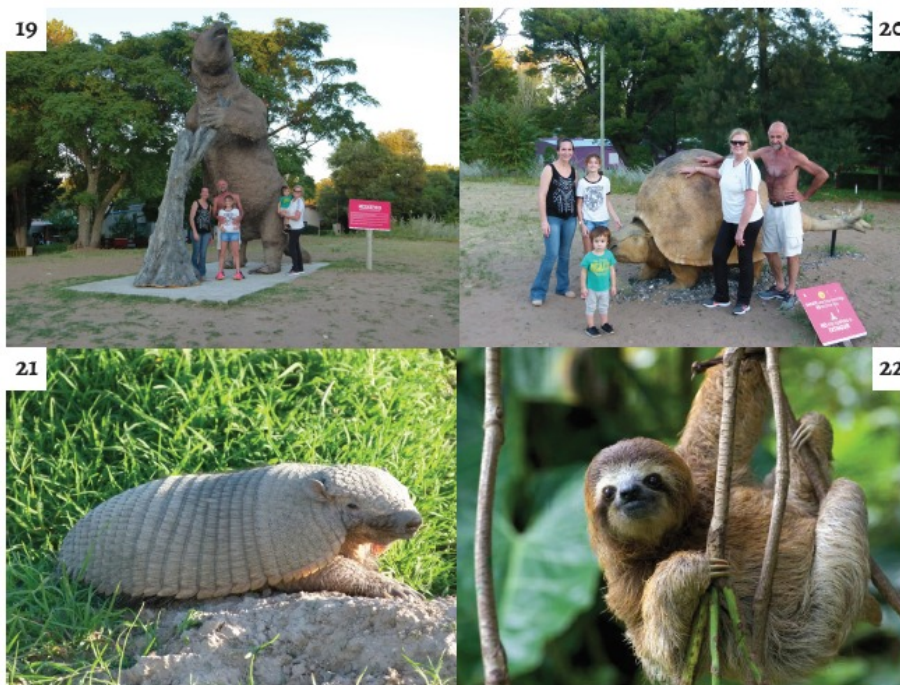
Figuras 19 y 20. Reproducción de megaterio y gliptodonte en la localidad de Pehuen Co. Figura 21. Peludo. Figura 22. Perezoso.